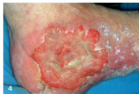
Mittelstarken bis starken Exsudatfluss zeigen meist chronische Wunden und Tumorwunden. Häufig bedarf auch die Wundumgebung einer guten Exsudatkontrolle: venös arterielles Mischulkus durch eine CVI und pAVK [1], exulzeriertes Mammakarzinom [2], Lymphstau mit Hautveränderungen durch einen Tumor [3], Ulcus cruris, verursacht durch ein Basaliom [4].

ein physikalisches Débridement mit hydroaktiven Wundauflagen.