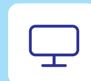
Beeldscherm, toetsenbord, touchscreens