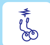
Kabels (medisch) apparatuur