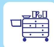
Werkoppervlak infuus-, verbandwagens, etc.